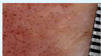
Punktgenaue Wirkung in der Tiefe der Haut.

Fraktionierte Hauterneuerung nennt sich das innovative Wirkprinzip des Fraxel-Lasers. Hierbei durchdringen Millionen mikroskopisch kleine Punkte die Hautoberfläche, ohne sie zu verletzen, um dann direkt an den Kollagenfasern in den tiefer gelegenen Schichten der Haut ihre stimulierende Wirkung zur Hauterneuerung zu entfalten »Primär verantwortlich für die Faltenbildung der Haut ist die nachlassende Spannkraft und Ausdünnung der Kollagenfasern. Dieser Prozess lässt sich mit dem Fraxel-Laser nun